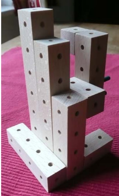
Abb. 1 Bauwerk 1

1. Versuche in einer Teamarbeit ( 2 Personen bilden ein Team) die Abbildungen mit Matadorbausteinen in der richtigen Anordnung und der richtigen Bausteinauswahl nachzubauen.